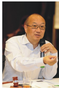
SEE 会长 冯仑致辞

2012年7月14日，SEE 协会四届二次理事会在深圳万科天琴湾召开。会议由会长冯仑主持，听取了秘书处关于SEE协会半年工作情况、阿拉善项目规划思路、SEE机构财务情况及发展思路，表决通过了《利益关联披露守则》和SEE加入“全球契约组织”和“世界自然保护联盟”的动议，听取了章程委员会主席任志强提交的章程修改意见。理事会对秘书处上半年工作成绩给予肯定，同时也对今后的工作提出了更高的要求。