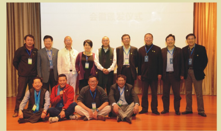
SEE 创始会员佩戴徽章